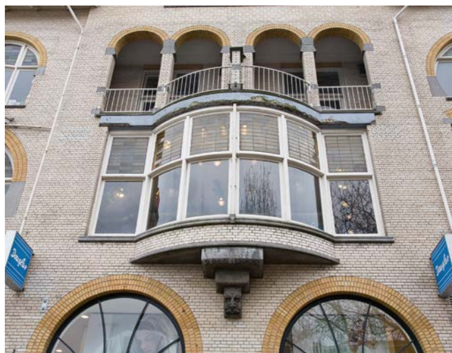
Vredenburg 3 in Utrecht, B. Van As 2010

Van het pand Scutterenboeck in Amsterdam, Singel 321, is bekend dat daar in 1553 twee erkers werden geplaatst. Het waren mogelijk de eerste voorbeelden in deze stad, maar ze zijn niet bewaard gebleven. Het enig overgebleven voorbeeld uit de zestiende eeuw is de erker aan het klooster in Ter Apel uit omstreeks 1554. Voorbeelden van zeventiende-eeuwse erkers